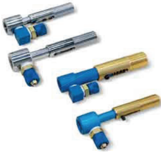
型号 20 80 ..