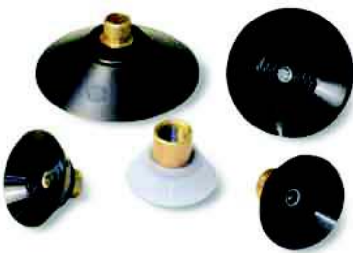
带外螺纹且经过硫化处理的接头的吸盘